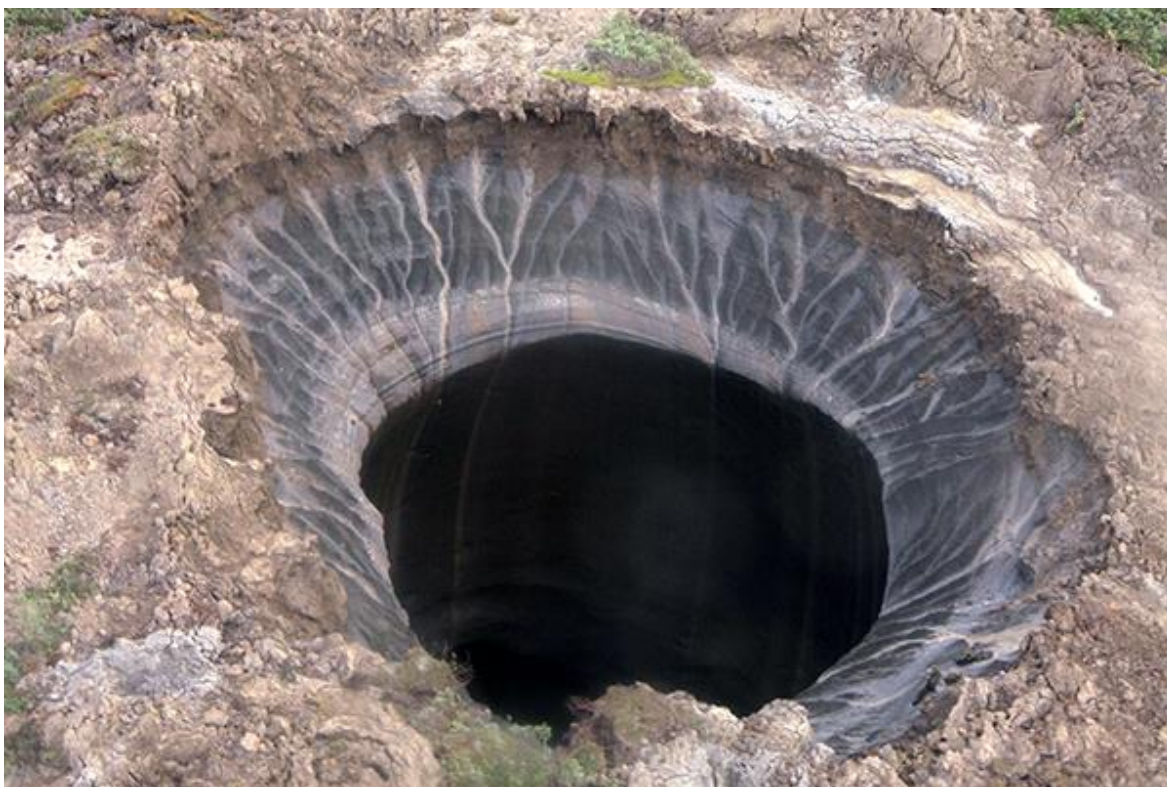
Рис. Гигантская воронка на Ямале.

Задание 9. В 2014 году на Ямале была обнаружена воронка, породившая массу слухов и научных предположений. Какова природа образования этой гигантской воронки? (5 баллов)