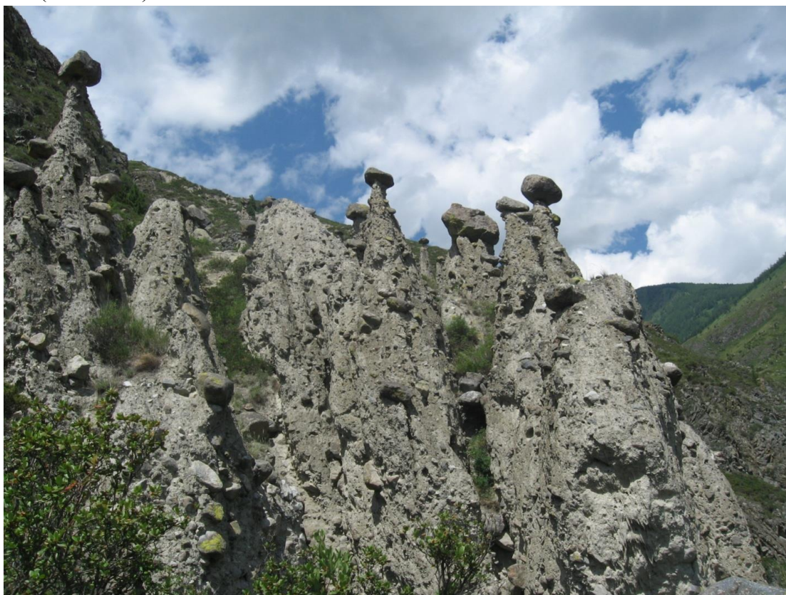
Рис. «Каменные грибы» в долине реки Чулышман.

Задание 6. Памятник природы «Каменные грибы» (рис.) расположен в Горном Алтае, в долине реки Чулышман, в месте впадения в него правого притока Карасу, на склоне, на высоте примерно 250 м над рекой. Каким, по Вашему мнению, может быть происхождение подобных форм рельефа? Чем представлены «шляпки грибов» и какую функцию они выполняют? Ответ обоснуйте. (13 баллов)