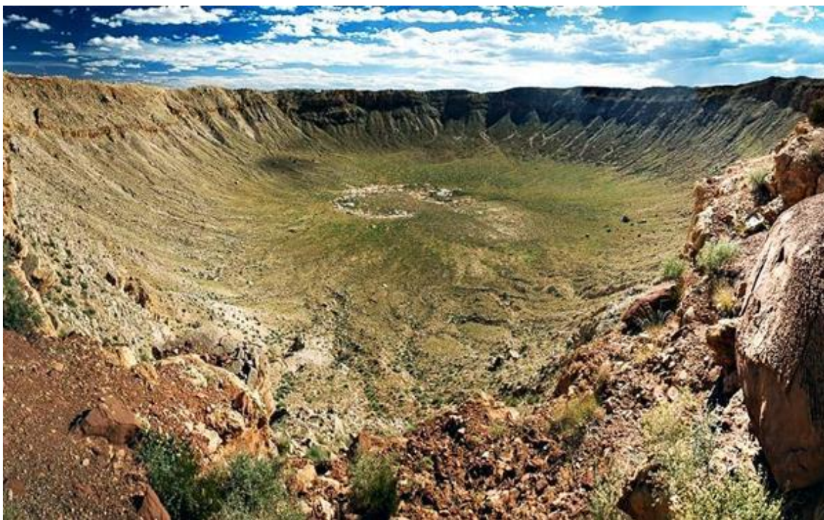
Рис. Вредефорт, ЮАР.

Задание 10. Это место в ЮАР называется Вредефорт. Оно в 2005 году было включено в объекты Всемирного наследия ЮНЕСКО. Как оно образовалось? (3 балла)