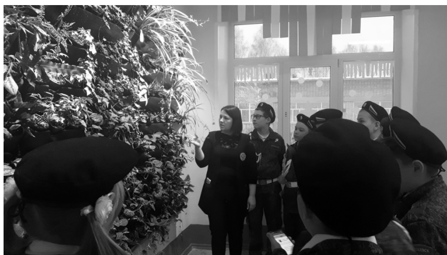
Рис. 1. окружающему фитостены

В школах фитостена может стать уникальным образовательным пространством для проведения урочных и внеурочных занятий по самым разным предметам (рис. 1).