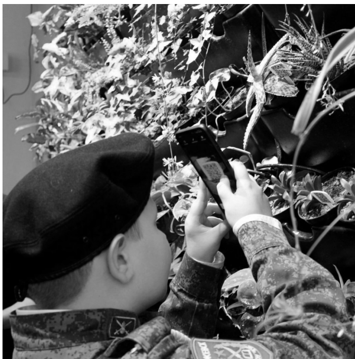
Рис. 4. Интерактивные возможности фитостены: название и описание каждого растения зашифрованы с помощью QR-кода

Опыт создания фитостены в школе кадетского движения города Ижевска показал, что данный элемент вертикального озеленения может стать образовательным пространством не только для проведения уроков биологии, экологии, географии, окружающего мира, но также технологии и английского языка.