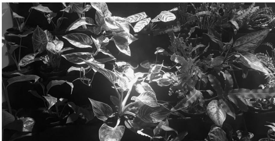
Рис. 2. Фрагмент