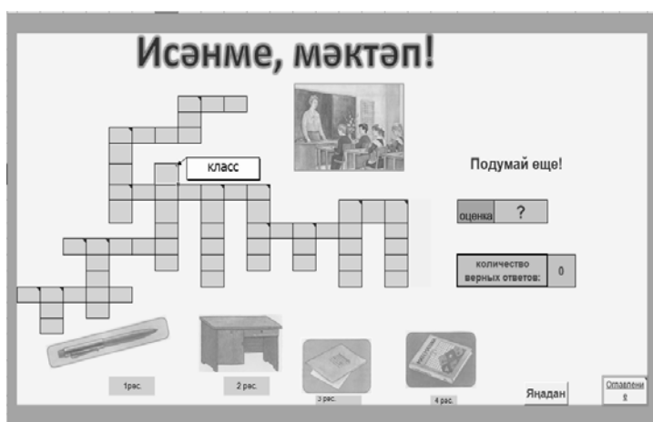
Рис.2. Кроссворд «Здравствуй, школа!»

Работать с электронным тренажером интересно и увлекательно!