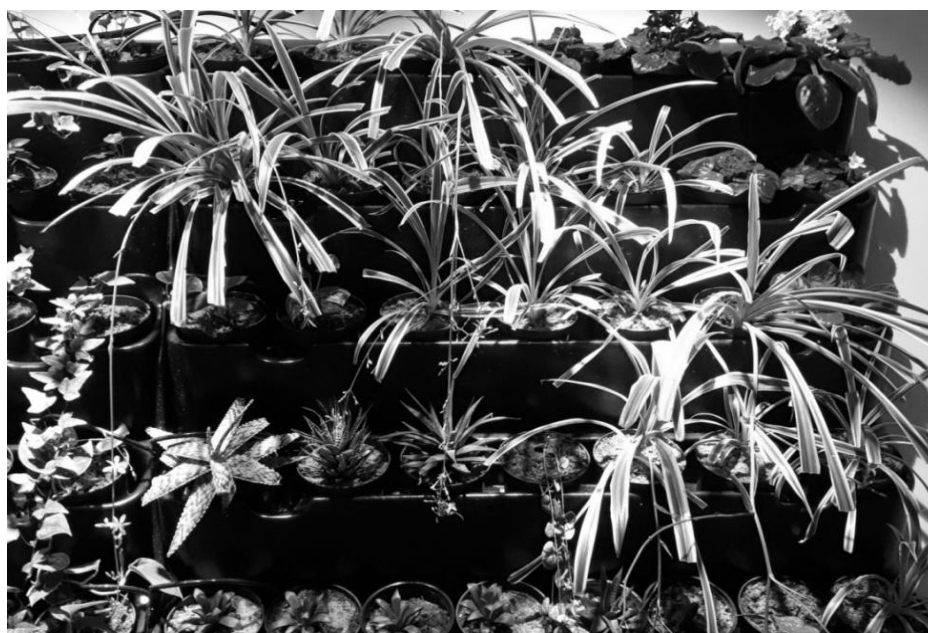
Рис. 3. Фрагмент фитостены «Растительные сообщества Африки»

Также на фитостене представлены растения Евразии ( Hedera helix , Ficus benjamina , Nephrolepis exaltata и др.) и Африки ( Ceropegia woodii , Chlorophytum comosum , Saintpaulia ionantha , Haworthia fasciata и др.) (рис. 3)