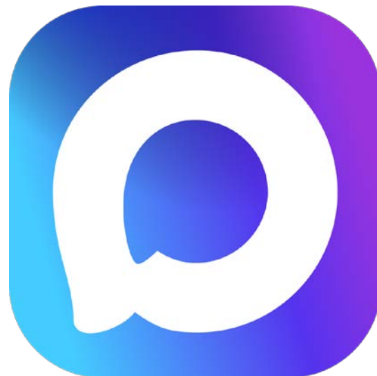
Группа курса в MAX